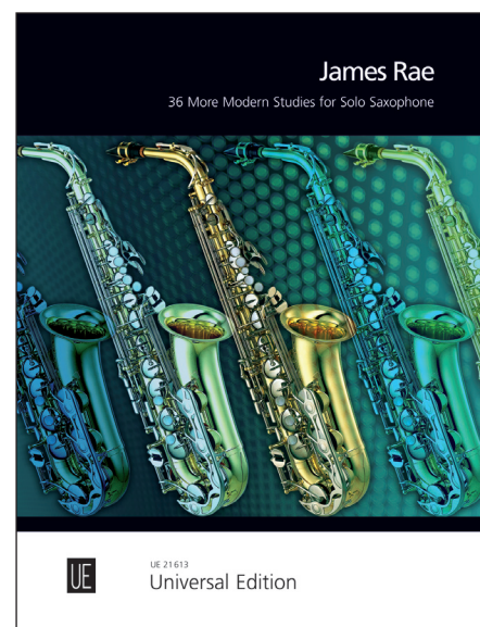
James Rae 36 More Modern Studies for Solo Saxophone UE 21 613